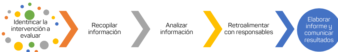
Ilustración 2 Pasos para realizar el análisis de evaluabilidad